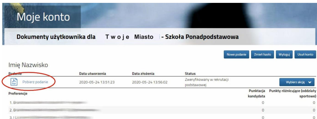
Rysunek nr 4

Następnie należy pobrać dokument korzystając z opcji Pobierz podanie (Rysunek nr 4), wydrukować i podpisać. Pozostałe dokumenty np. oświadczenia potwierdzające spełnianie kryteriów również należy wydrukować, wypełnić i podpisać.