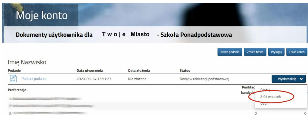
Rysunek nr 2

W kolejnym kroku należy wybrać opcję Złóż wniosek (Rysunek nr 2).