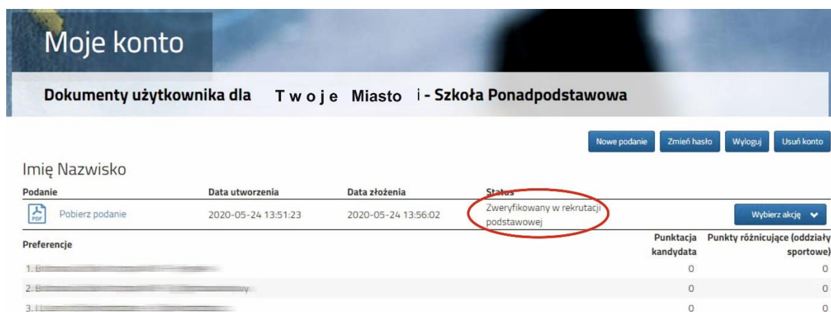
Rysunek nr 3

Po kliknięciu Złóż wniosek status dokumentu zmieni się z Nowy wniosek w rekrutacji podstawowej na Zweryfikowany w rekrutacji podstawowej (Rysunek nr 3). Od tego momentu zmiany na wniosku może wykonać tylko szkoła pierwszego wyboru.