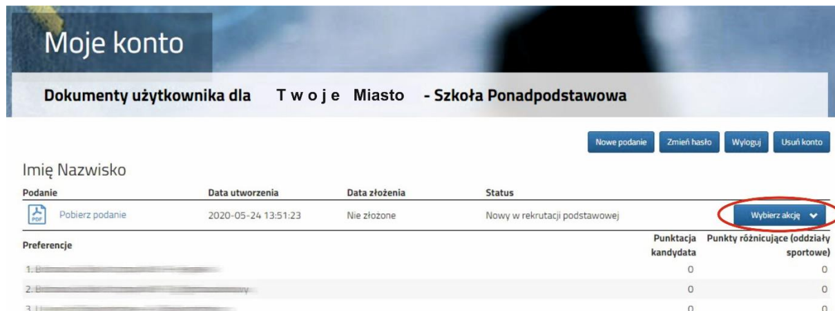
Rysunek nr 1

Przy wniosku, który chcemy wysłać do szkoły należy kliknąć przycisk Wybierz akcję (Rysunek nr 1).