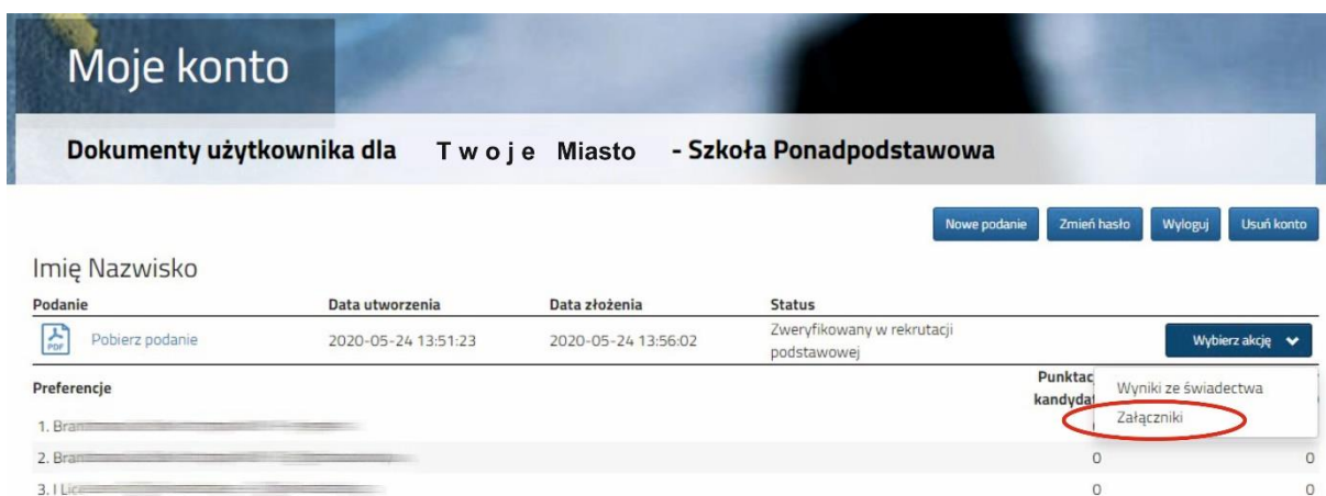
Rysunek nr 5

Po zeskanowaniu/zrobieniu zdjęć wszystkich dokumentów można je wysłać za pomocą systemu do szkoły pierwszego wyboru. W tym celu należy kliknąć przycisk Wybierz akcję następnie Załączniki (Rysunek nr 5).